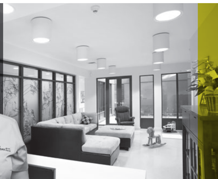
MAISON DE NAISSANCE DE LA CAPITALE-NATIONALE, Québec