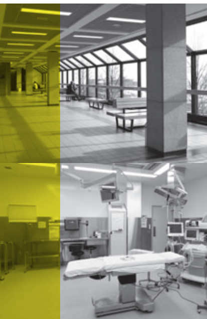
HÔPITAL DE SAINT-EUSTACHE Saint-Eustache