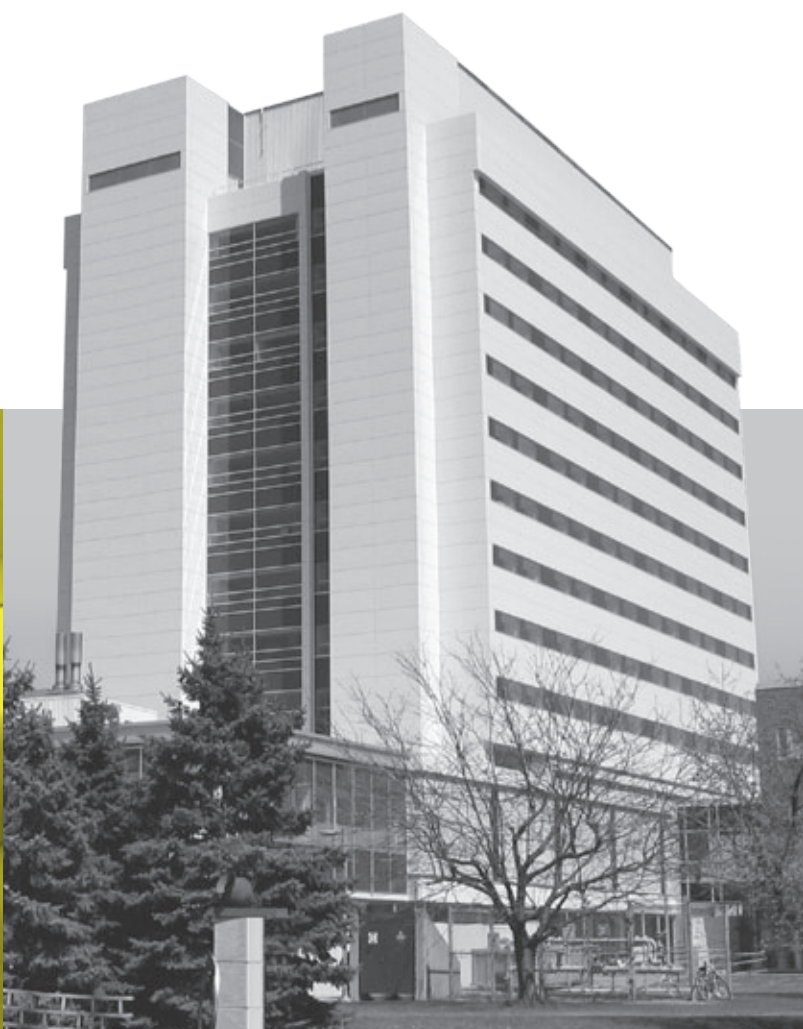
HÔPITAL HONORÉ-MERCIER Saint-Hyacinthe