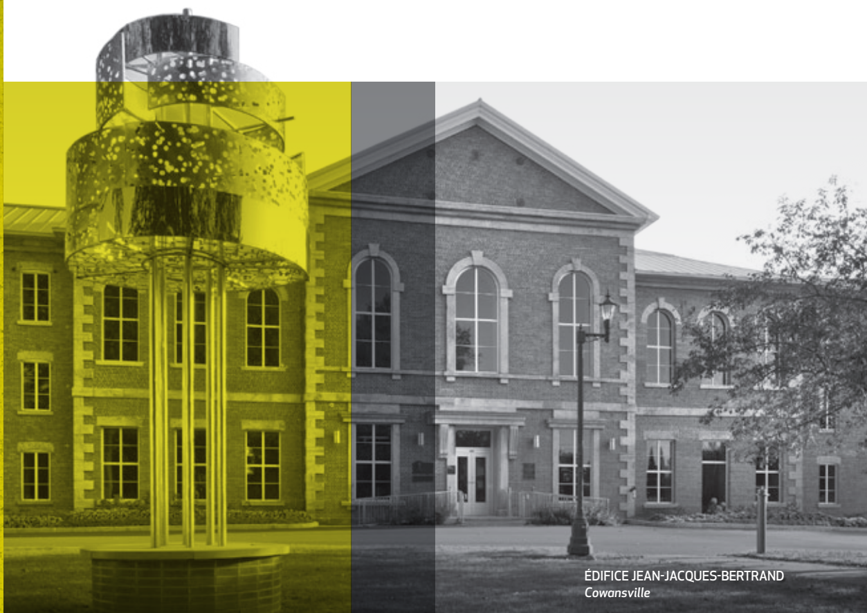
ÉDIFICE JEAN-JACQUES-BERTRAND Cowansville