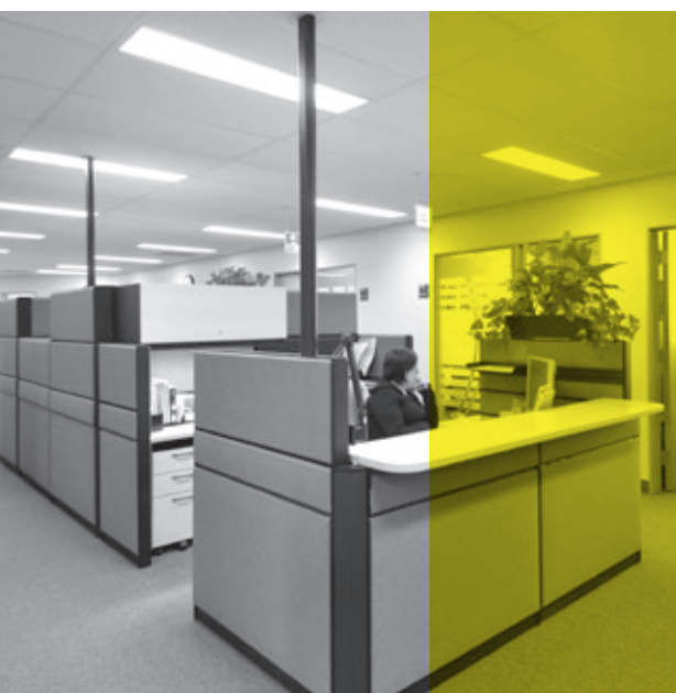
ÉDIFICE JEAN-BAPTISTE-DE LA SALLE Québec

LA SIQ, UNE ENTREPRISE CERTIFIÉE ISO 9001 POUR SES SERVICES À LA CLIENTÈLE.