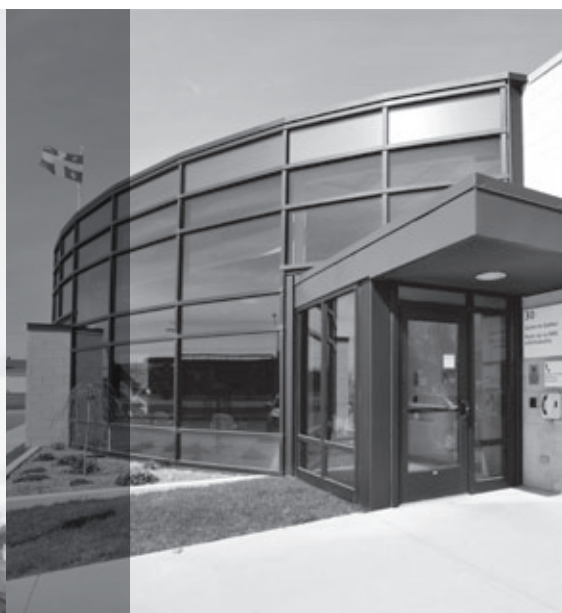
QUARTIER GÉNÉRAL DU DISTRICT MONTRÉAL-LAVAL-LAURENTIDES-LANAUDIÈRE DE LA SÛRETÉ DU QUÉBEC, Mascouche Édifice certifié LEED OR

Récipiendaire du « Prix d'excellence cecobois » pour son revêtement extérieur en peuplier torréfié. Les systèmes électromécaniques de cet édifice permettent des économies d'énergie de l'ordre de 50 % par rapport à une construction traditionnelle.