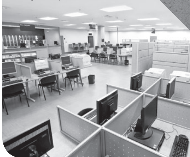
CENTRE LOCAL D'EMPLOI, Longueuil Aménagement certifié LEED