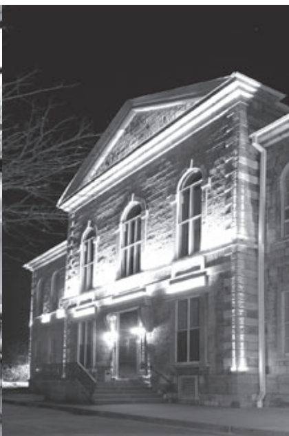
PALAIS DE JUSTICE La Malbaie