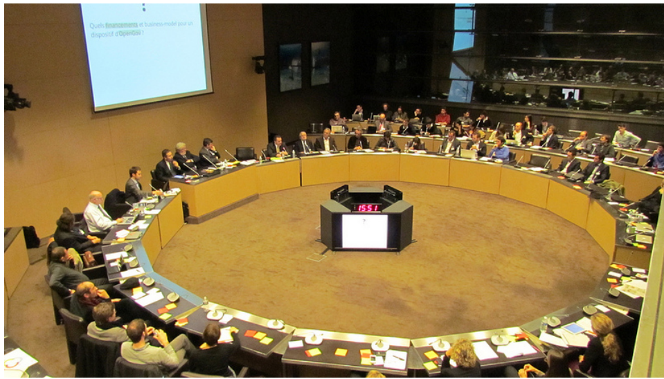
10 avril 2012, Premier « gouv camp » du collectif démocratie ouverte, Assemblée nationale française

Les participants se sont rendus compte que "le mouvement [de l'OpenGov] est en marche, plutôt que de savoir s'il faut y aller, la question est surtout celle du temps qu'on mettra pour s'y plonger réellement". Le numérique présente de formidables opportunités pour faire des économies d'échelle, pour gouverner de manière transparente, participative et collaborative. 3