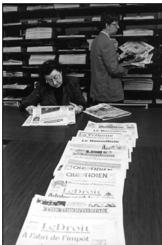
La salle de consultation des périodiques de la Bibliothèque de l'Assemblée nationale.

diverses entités. Dans le modèle inspiré de la pratique américaine, la fonction recherche est antérieure, administrativement parlant, à la fonction plus proprement documentaire : l'impulsion viendrait normalement des activités de recherche, lesquelles orienteront les travaux entrepris au sein des services de référence. À l'opposé, on peut affirmer que les services de recherche apparus dans les parlements de type britannique ont eu à composer avec des réflexes, des pratiques et une organisation traditionnels, à s'imposer et à faire valoir leur originalité vis-à-vis de professions bien implantées tout en s'appuyant sur leurs connaissances et leurs savoir-faire bibliographiques. À mi-chemin entre les deux façons de faire, on a la multiplicité des services documentaires «indépendants», sans liens hiérarchiques avec les services limitrophes, observée en France : là, les services sont autonomes 8 les uns par rapport aux autres et les efforts de coordination sont commandés par des cadres