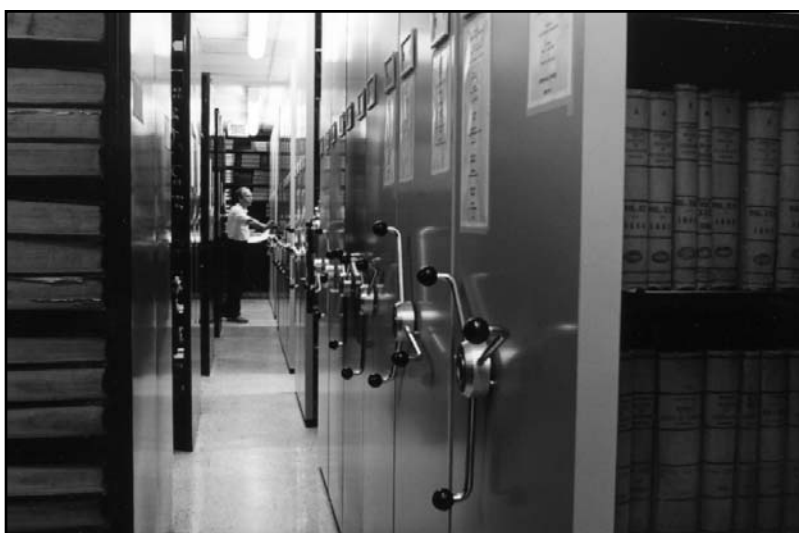
Le magasin de la Bibliothèque de l'Assemblée nationale.

créneau plus voyant, a pu hérisser les bibliothécaires et les bibliotechniciens, jusque-là «notables» incontestés de la documentation, exerçant un quasi-monopole en la matière. Encore en 1985, on retrouve des traces d'aspérités ou de frictions entre les deux groupes, en tout cas d'une sensibilité certaine, dans un document de travail : «Il importe, y lisait-on, de supprimer l'esprit d'une hiérarchie basée sur un concept de