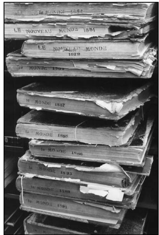
Les collections anciennes ont subi l'outrage des ans. (photo Louise Côté).

Il reste, cela va de soi, bien des ajustements à faire, surtout dans le déroulement des travaux et des jours. Des requêtes identiques sont acheminées aux deux endroits et on prend parfois quelques heures avant de se rendre compte que les deux groupes cherchent parallèlement et simultanément la même information. On