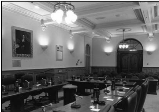
La salle Louis-Joseph-Papineau au rez-de-chaussée de l'Hôtel du Parlement (ANQ-Q, coll. Ministère des communications, 87 24 B6, photo Marc Lajoie).

L'Assemblée nationale possède un portrait de Louis-Joseph Papineau qui était autrefois accroché dans la Bibliothèque. En mai 1985, lors du réaménagement des salles de commissions, au rez-de-chaussée de l'Hôtel du Parlement, il a été installé dans la salle qui porte le nom du fameux parlementaire né en 1786 et décédé en 1871.