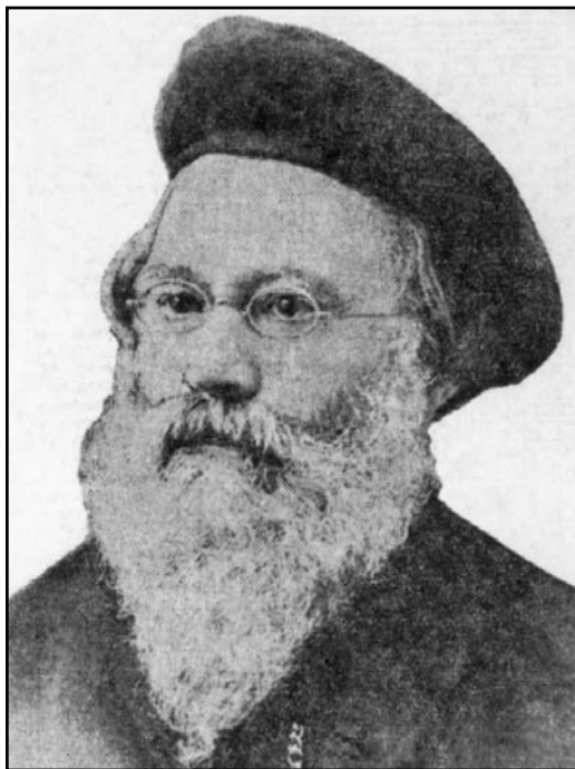
· Amédée Papineau (1819-1903), fils de · Louis-Joseph Papineau ·

Amédée Papineau avait fait encadrer le portrait par Rhéaume frères, 75, rue Saint- Laurent, à Montréal. Les instructions qu'il avait données à cette fin ne laissent aucun doute sur les origines de l'encadrement: