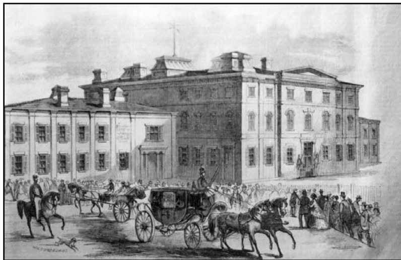
Le bureau du sergent d'armes était situé au deuxième étage de l'aile gauche de l'Hôtel du Parlement, construit en 1859 dans ce qui est aujourd'hui le parc Montmorency.

Deux jours plus tard, l'adoption de cet amendement suscite une dernière intervention, celle du député représentant Saint-Roch, J.-P. Rhéaume, ancien échevin du quartier par surcroît: