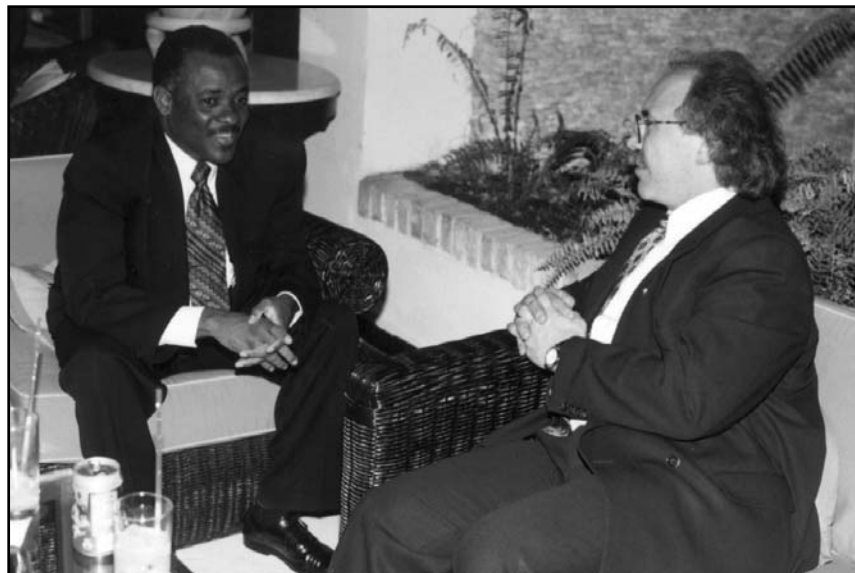
Le président du Sénat du Parlement d'Haïti, M. Edgard Leblanc fils, et M. Jean-Pierre Charbonneau, président de l'Assemblée nationale.

du Parlement d'Haïti multiplient les échanges à caractère multi-latéral et bilatéral. La reprise des contacts avec le Parlement d'Haïti, déjà tentée en mars 1991 mais suspendue par le coup d'État de septembre de la même année, fut rendue possible à la suite du rétablissement de la démocratie parlementaire en Haïti, vers la fin de 1994. C'est à