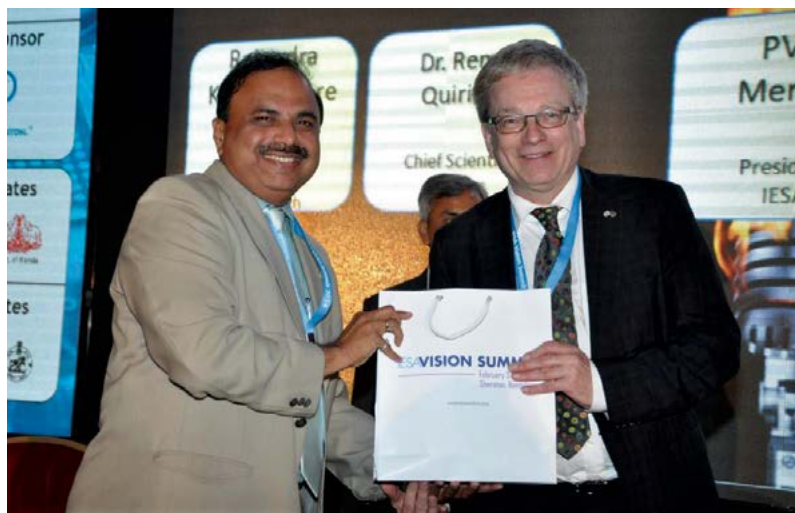
Les rencontres du scientifique en chef lors de son passage en Inde se sont concrétisées entre autres par l'appui à l'établissement du secrétariat de Future Earth à Montréal.

Le scientifique en chef a effectué une mission du 2 au 9 février 2014 dans trois grandes villes indiennes :