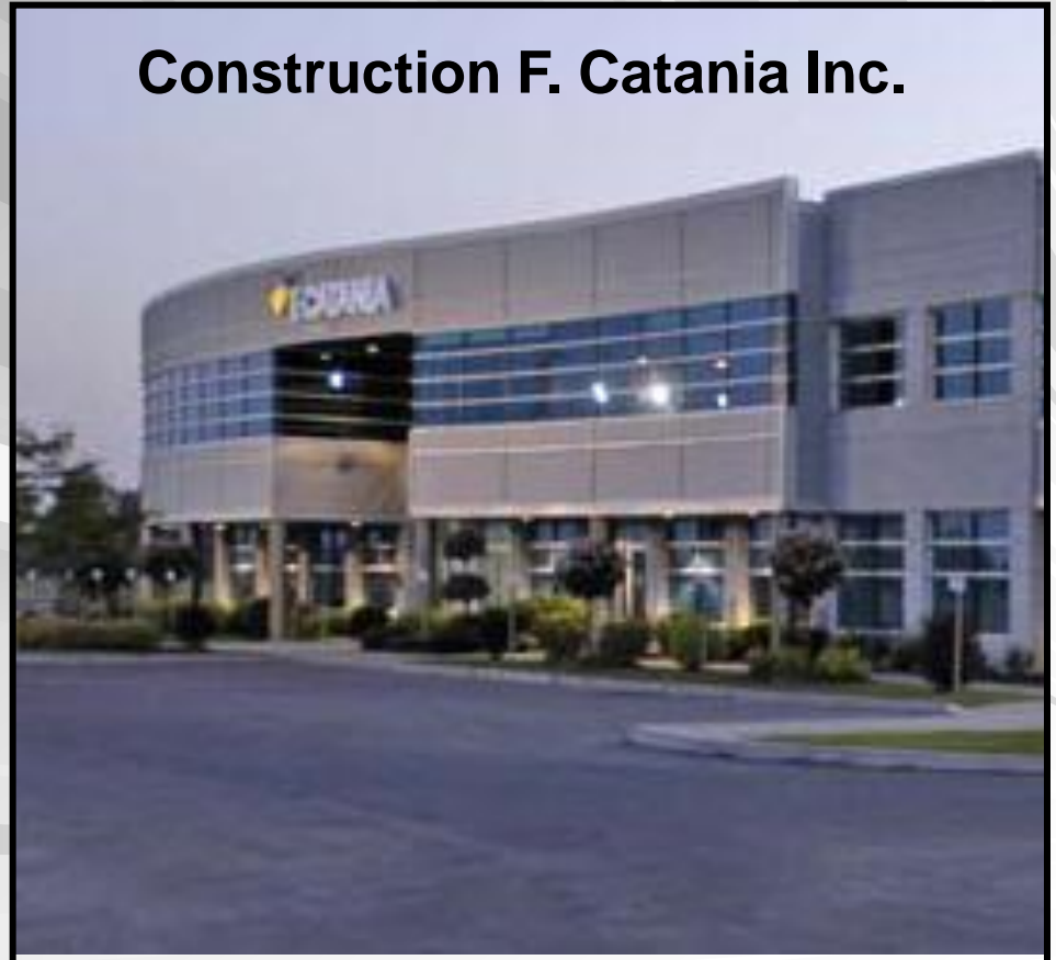
Construction F. Catania Inc.