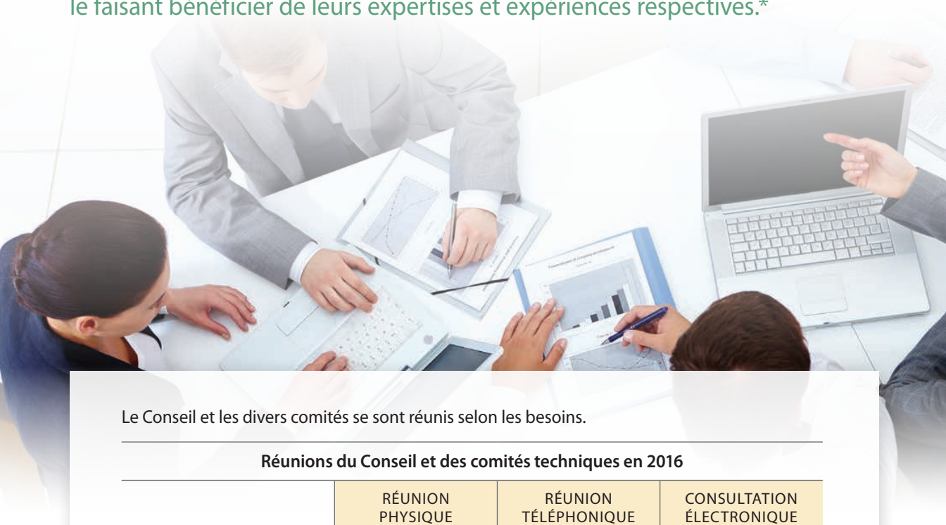
Le Conseil et les divers comités se sont réunis selon les besoins.

Trente-deux autres personnes ont également participé aux travaux de 10 comités consultatifs formés pour appuyer le CARTV dans son travail, le faisant bénéficier de leurs expertises et expériences respectives.*