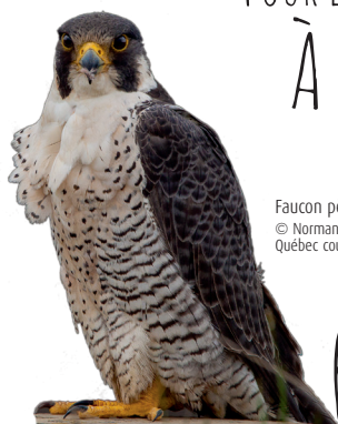
Faucon pèlerin