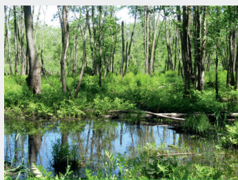
Lac Saint-Pierre

Afin de conserver la biodiversité et la pérennité des usages, l'Agence forestière des Bois-Francs entend préserver les marécages arborés qui bordent la rive sud du lac Saint-Pierre. Pour ce faire, l'Agence sensibilise les propriétaires riverains à l'importance de leur boisé et évalue leur potentiel de régénération. Parmi les propriétaires rencontrés, dix d'entre eux se verront remettre un plan d'aménagement qui pourrait inclure la réintégration de certaines essences rares dans leur boisé (ex. érable argenté, caryer cordiforme, chêne bicoloré, micocoulier occidental).