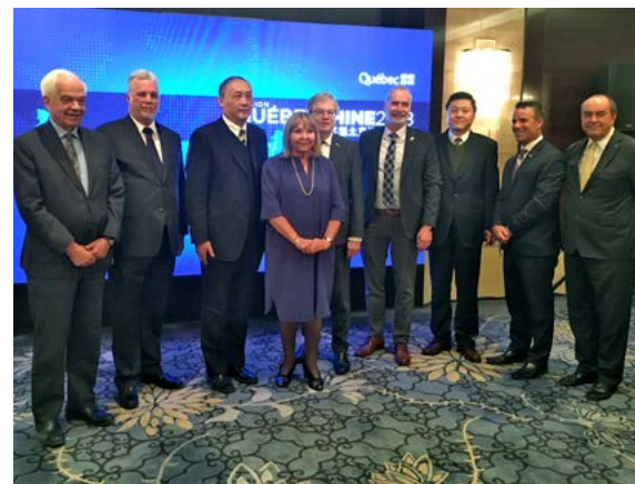
Des ententes de partenariat ont été renouvelées au cours de la mission en Chine.

Entre les 20 et 26 janvier 2018, au cours d'une mission économique du premier ministre du Québec, Philippe Couillard, en Chine (Beijing, Hangzhou, Shanghai) à laquelle il prenait part, le scientifique en chef du Québec a renouvelé l'entente de collaboration et de partenariat entre la National Natural Science Foundation of China et les FRQ. Dans les suivis de cette entente, le Fonds de recherche du Québec – Société et culture a reçu une délégation chinoise lors d'un colloque sur les villes intelligentes et un second colloque est planifié en Chine sur la question des données massives.