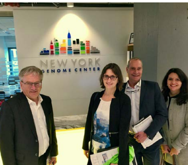
Visite d'un organisme de recherche à New York.