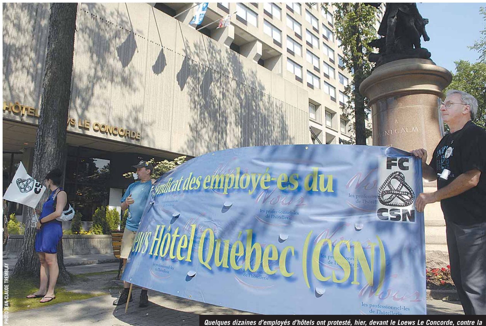
Quelques dizaines d'employés d'hôtels ont protesté, hier, devant le Loews Le Concorde, contre la lenteur des négociations autour de leurs conditions de travail.