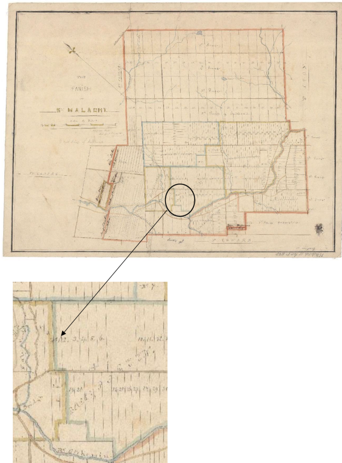
Figure 1. The Parish of St Malachy, 1870. BAnQ, E21, S555, SS1, SSS14, PM, 1