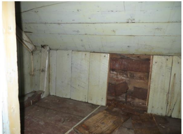
Figures 26 à 29. Maison sise au 1201, avenue Principale. Vues intérieures, étage, (descentes d'escaliers, chambres), 2019. MCC