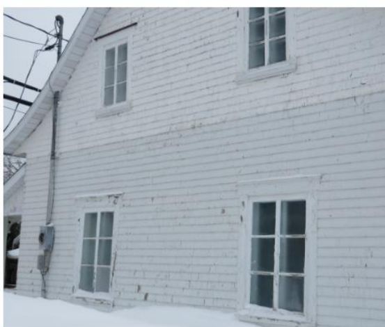
Figures 3 à 8. Maison sise au 1201, avenue Principale. Vues extérieures, 2019. MCC