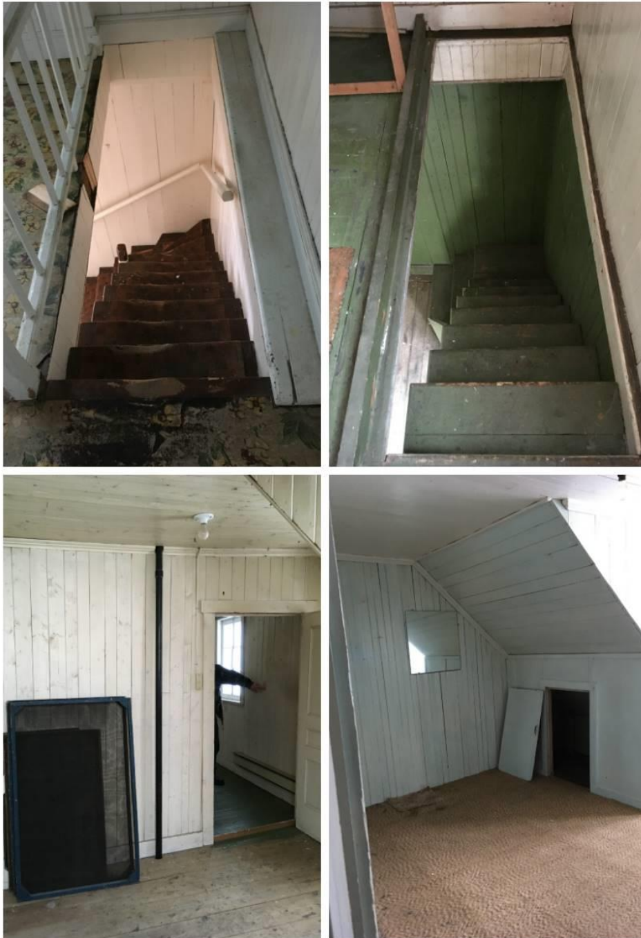
Figures 22 à 25. Maison sise au 1201, avenue Principale. Vues intérieures, étage, (descentes d'escaliers, chambres), 2019. MCC