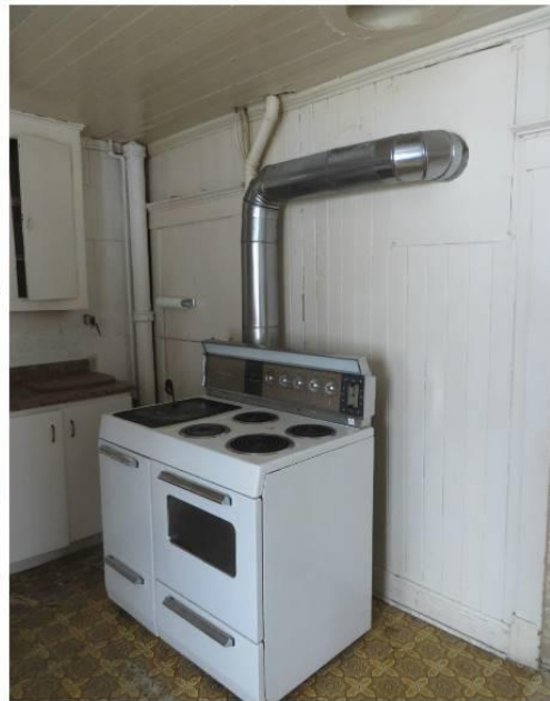
Figures 10 à 13. Maison sise au 1201, avenue Principale. Vues intérieures, rez-de-chaussée (cuisine 1), 2019. MCC