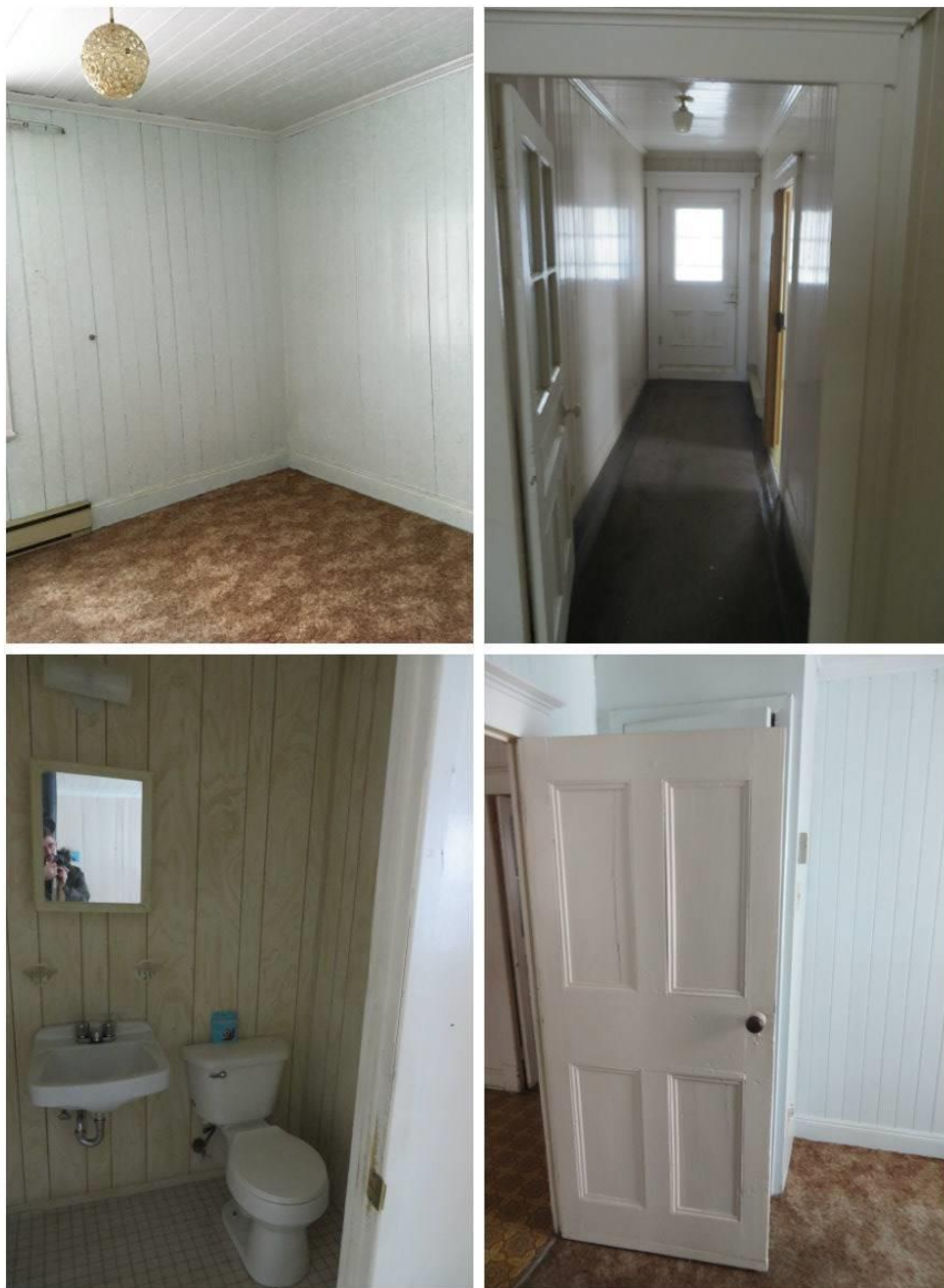
Figures 18 à 21. Maison sise au 1201, avenue Principale. Vues intérieures, rez-de-chaussée, (chambre, entrée, salle d'eau, chambre), 2019. MCC