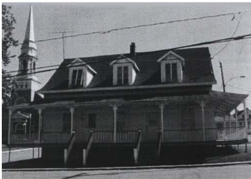
Figure 33. Maison sise au 1201, avenue Principale, 1994.