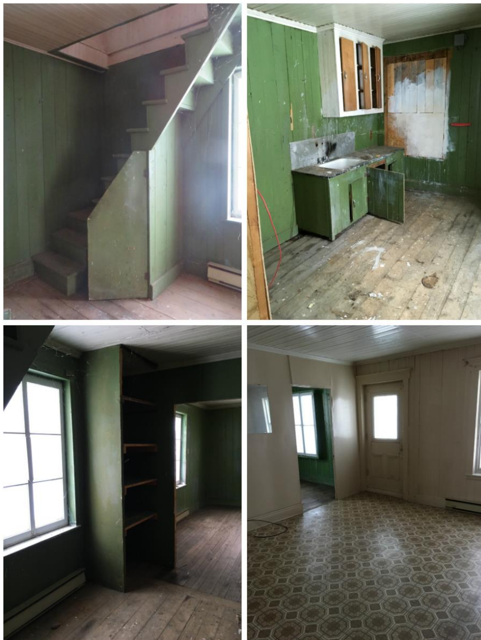
Figures 14 à 17. Maison sise au 1201, avenue Principale. Vues intérieures, rez-de-chaussée, (cuisine 2, salons), 2019. MCC