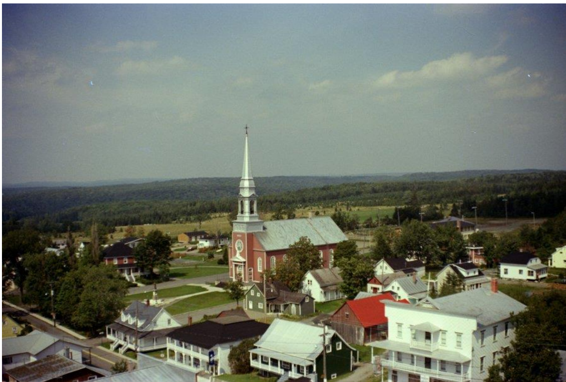
Figure 32. Photographie aérienne, 1979.