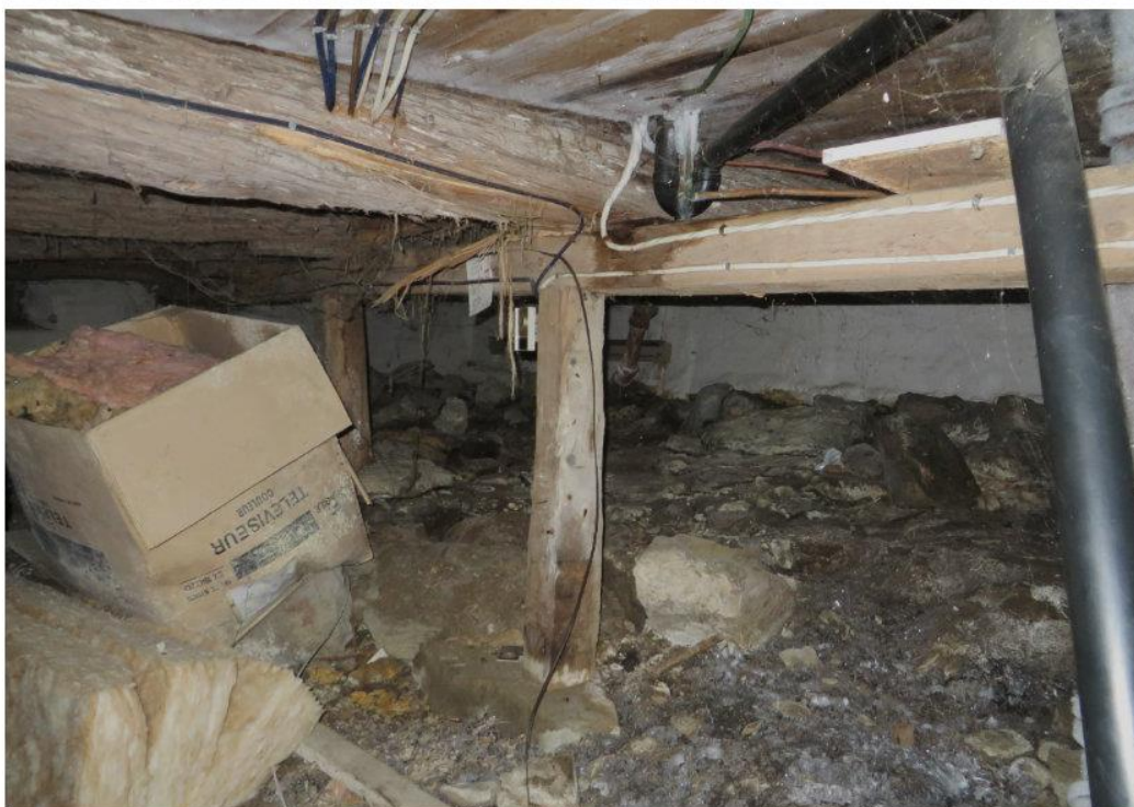
Figures 30 et 31. Maison sise au 1201, avenue Principale. Vues intérieures, vide sanitaire, 2019. MCC