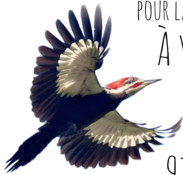
Grand pic