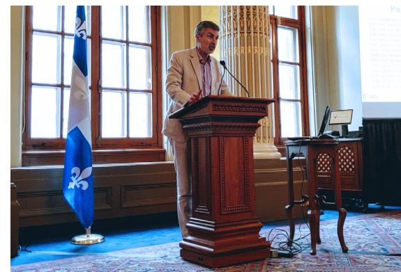
Yoshua Bengio lors du 10 e déjeuner scientifique.

Au cours de l'année 2019, le scientifique en chef du Québec a organisé à l'Assemblée nationale du Québec trois déjeuners scientifiques pour les parlementaires, les chefs de cabinet et les sous-ministres, afin de leur présenter l'étendue de l'expertise dont ils peuvent bénéficier grâce à la recherche. Le 27 février 2019, le professeur émérite et économiste Pierre Fortin a été invité pour parler de plein-emploi et des enjeux et défis que cela représente pour le Québec. Un mois plus tard, le thème à l'honneur était le Québec face à l'intelligence artificielle, avec la participation de Lyse Langlois, directrice de l'OBVIA, et de Nathalie de Marcellis-Warin, directrice générale du Centre interuniversitaire en analyse des organisations. Ces deux événements ont été suivis, le 5 juin 2019, par une rencontre avec Yoshua Bengio, chercheur en intelligence artificielle de renommée internationale et colauréat du prix Turing, le « Nobel de l'informatique ».