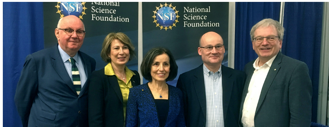
† Des têtes dirigeantes de haut niveau entourent Rémi Quirion lors du congrès de l'AAAS.