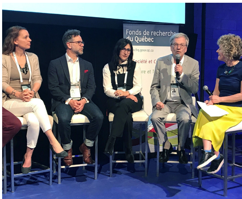
Discussion sur les pratiques novatrices en recherche lors du Sommet de Montréal sur l'innovation.

Dans le cadre des activités de l'INGSA, le bureau du scientifique en chef a mené du 24 au 30 août 2019 une mission à Yaoundé, au Cameroun. Parmi les activités tenues, mentionnons un atelier en conseil scientifique aux gouvernements présidé par le ministre d'État et ministre de l'Enseignement supérieur, Jacques Fame Ndongo, qui a souligné le rôle structurant du conseil scientifique pour l'Afrique. Notons aussi des audiences auprès des ministères de l'Enseignement supérieur, des Relations extérieures et de la Recherche scientifique et de l'Innovation, où il a été question de consolider la collaboration entre le Québec et le Cameroun en matière de recherche et d'innovation.