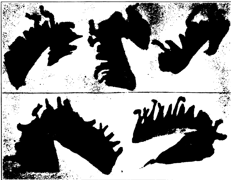
LERNAEPODA EDWARDSII -- Le copépode parasite de la truite mouchetée (SALVELINUS FONTINALIS) dans certains lacs.