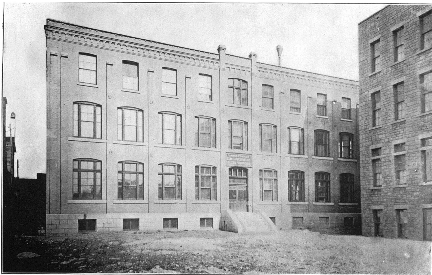
ÉCOLE POLYTECHNIQUE DE MONTRÉAL.—Façade de l'édifice des laboratoires.