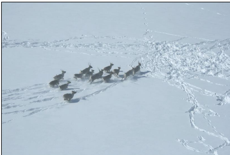
Caribou forestier ( Rangifer tarandus caribou )