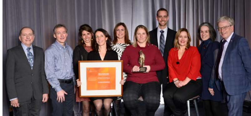
Équipe lauréate du prix Collaboration scientifique, remis lors du Congrès annuel de l'IAPQ.