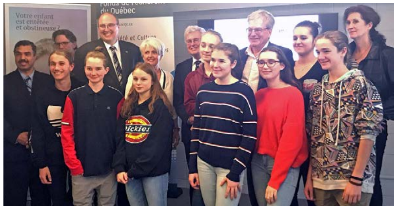
📍 Célébration joyeuse pour les 20 ans du programme Chercheur-e d'un jour.