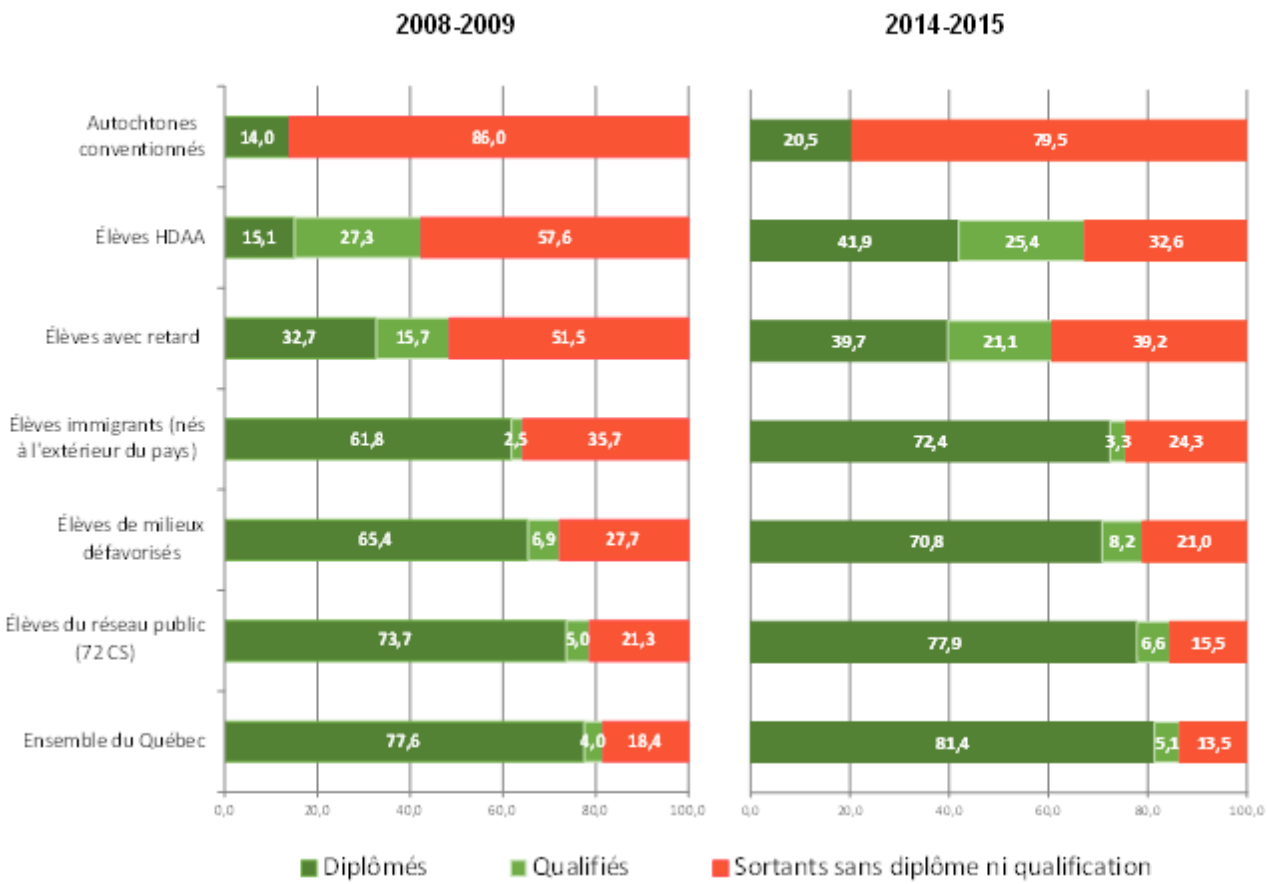
Répartition (en %) des élèves sortants du secondaire en FGJ selon certaines caractéristiques, ensemble du Québec, années scolaires 2008-2009 et 2014-2015

Pour conclure, voici les taux de sorties sans diplôme ni qualification au secondaire en FGJ présentés par réseau d'enseignement et par commission scolaire (CS). Pour le réseau public, il est à noter que 44 des 72 CS présentent un taux de sorties sans diplôme ni qualification en FGJ inférieur à la moyenne de 15,5 %. De plus, neuf CS affichent un taux légèrement supérieur à la moyenne (moins de deux points de pourcentage). À l'opposé, six CS présentent un taux supérieur à la moyenne de 10 points de pourcentage ou plus.