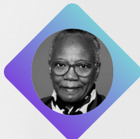
L'HONORABLE Wanda Thomas Bernard