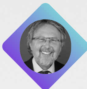
L'HONORABLE Stan Kutcher