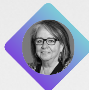
L'HONORABLE Frances Lankin, c.p.