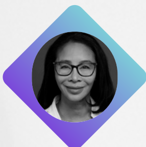
L'HONORABLE F. Gigi Osler