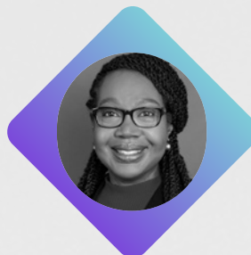
L'HONORABLE Sharon Burey