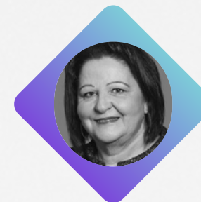
L'HONORABLE Rose-May Poirier