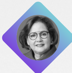
L'HONORABLE Rosemary Moodie