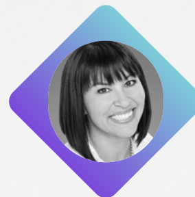
L'HONORABLE Chantal Petitclerc