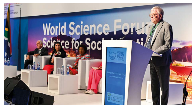
Rémi Quirion (scientifique en chef du Québec), en séance plénière au World Science Forum, Afrique du Sud, décembre 2022

Montréal accueillait la 15 e conférence des parties à la Convention sur la diversité biologique des Nations Unies, la COP15, en décembre 2022. Le scientifique en chef du Québec y a participé, lors d'une journée organisée par Réseau Environnement. Il a pu présenter les activités de son bureau ainsi que des programmes des FRQ en lien avec la biodiversité, les changements climatiques et la santé.