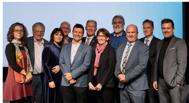
Lancement de la chaire de recherche en santé durable, 24 janvier 2023