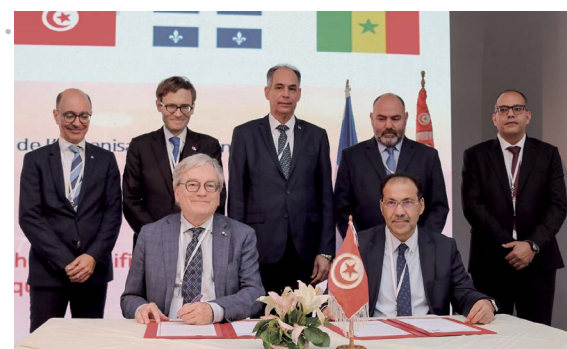
Signature d'un accord-cadre de coopération entre les FRQ et le ministère de l'Enseignement supérieur et de la recherche scientifique tunisien (MESRS)

L'automne 2022 a été riche en engagements et collaborations avec des partenaires internationaux. Le Sommet sur la science des Nations Unies tenu à New York, en septembre 2022, a été l'occasion d'aborder plusieurs thèmes : culture et science, efficacité du conseil scientifique, rôle des organismes subventionnaires pour l'atteinte des grands objectifs de développement durable de l'ONU, etc.