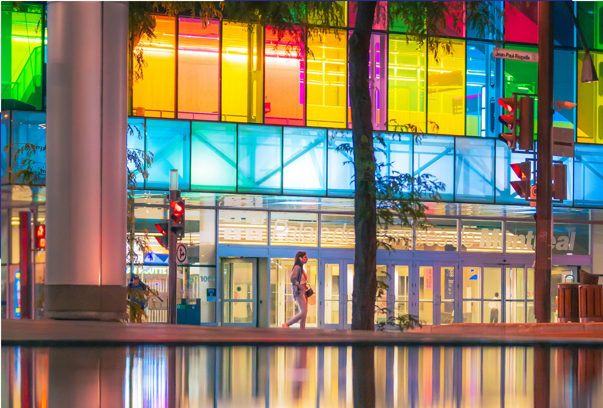
→ Entrée du Palais des congrès de Montréal.