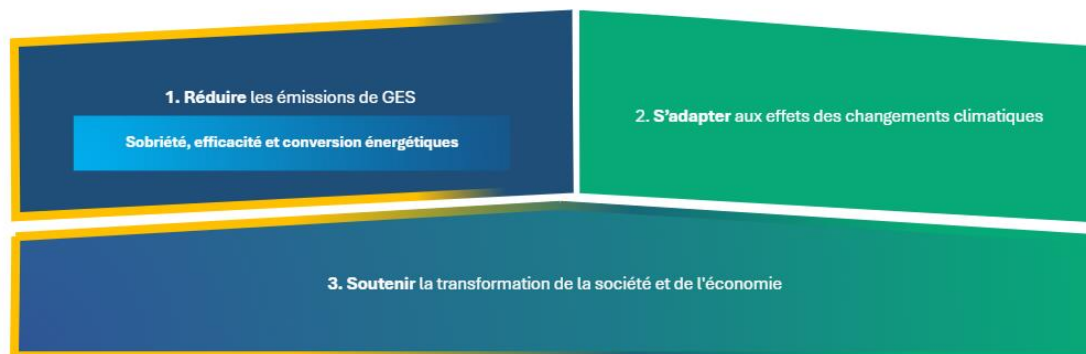
Figure 1. Les trois axes du futur plan (l'efficacité, la sobriété et la conversion énergétiques constituent les principaux vecteurs de la réduction des émissions de GES)

Le PMO 2024-2029 mise davantage sur la sobriété et l'efficacité énergétiques pour favoriser l'atteinte des cibles globales de réduction des émissions de GES du Québec. Plus clair et plus concis, il présente une structure renouvelée. La figure 1 ci-dessous présente les axes du futur plan.