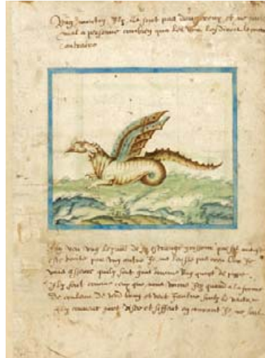
Prêt de la John Carter Brown Library

C'est ce document exceptionnel, dont le titre est Brief discours des choses plus remarquables que Samuel de Champlain de Brouage a reconnues aux Indes Occidentales , que l'Assemblée nationale du Québec est heureuse d'exposer pour la toute première fois au Québec. Ce célèbre manuscrit provient de la John Carter Brown Library, située à Providence dans le Rhode Island aux États-Unis, qui en a fait l'achat à Paris en 1884.