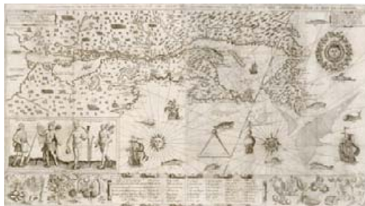
Champlain, Samuel de, Carte de la Nouvelle-France (1613). Fac-similé de la John Carter Brown Library.

Dans les années 1620, Champlain cesse ses voyages d'exploration pour se consacrer à sa tâche d'administrateur. Le jour de Noël 1635, il rend l'âme après avoir consacré 27 années à l'épanouissement de la colonie. Depuis, le génie et l'audace de ce grand homme n'en finissent plus de surprendre et d'émerveiller.